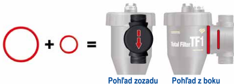
Pohľad zo zadu

Pre vertikálne potrubie prúdiace dole, pridajte červený krúžok a červenú vymedzovaciu vložku.