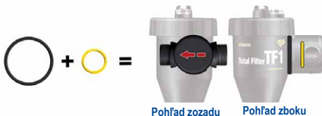
Pohľad zo zadu

Pre horizontálne potrubie prúdiace z ľava do prava pridajte žltý krúžok a čiernu vymedzovaciu vložku.