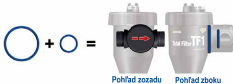
Pohľad zo zadu

Pre horizontálne potrubie prúdiace z prava do ľava pridajte modrý krúžok a modrú vymedzovaciu vložku.