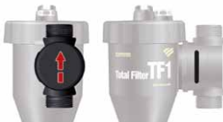
Pohľad zo zadu